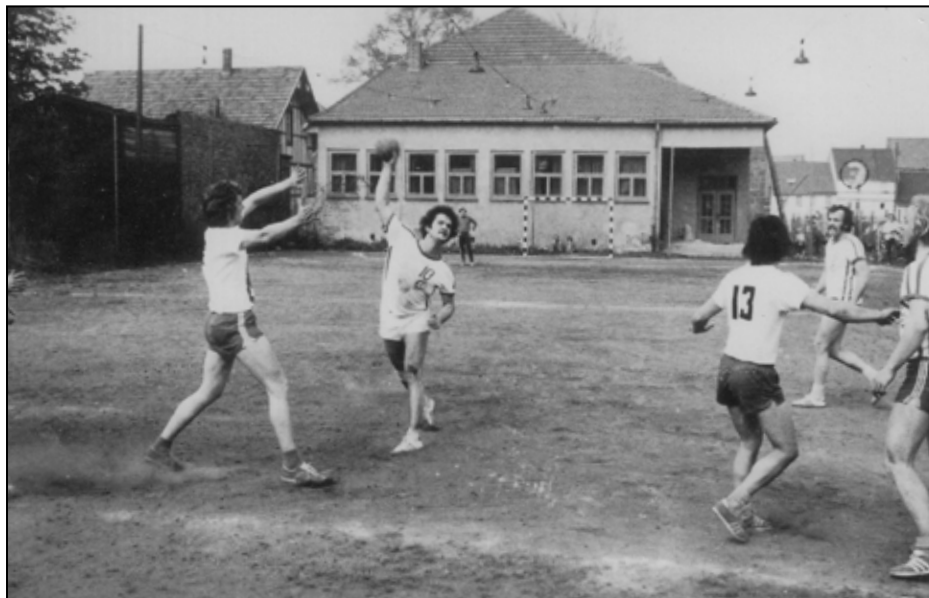
Serienspiel auf dem Kleinfeld 1974:

wie Arme und insbesondere Hüfte und Beine mit eben diesem Sandbelag in Kontakt kamen. Dann hatte man - sozusagen als Erinnerung an ein solches Spiel - Tage und manchmal sogar Wochen zu kämpfen, ehe die Wunden, die in der Regel auch eiterten, abgeheilt waren. Aber auch wenn man davon verschont blieb, musste man – besonders bei starken Schweißausbrüchen - den sich vornehmlich an Beinen und Armen festsetzenden Staubbelag nach Ende des Spieles abspülen.