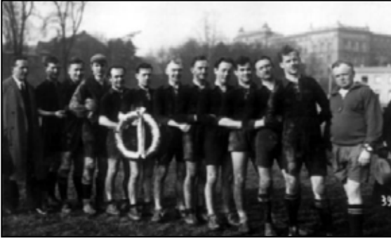
März 1931: Auf der Hessenkampfbahn in Kassel wird der Turnverein ‚Jahn‘ Eschwege zum dritten Mal Kreismeister