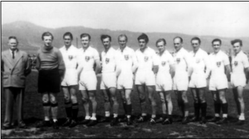
09.05.1948: Die I. Herrenmannschaft des Turnvereins 1861 Eschwege vor dem Jubiläumsspiel (100 Jahre Tv. 1861 Eschwege) gegen den TuS Schwanheim

Logische Konsequenz war – auch für die Zuschauer – dass viel mehr Tore zu bejubeln waren. Dennoch blieb man weiterhin von Witterungseinflüssen und Platzverhältnissen sowohl als Spieler als auch als Zuschauer betroffen. Das Spiel blieb trotz alledem oft eben kein Zuckerschlecken für Spieler und Zuschauer, wengleich es die Aktiven damals sicherlich nicht so gesehen haben.