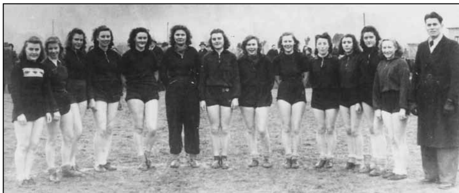
Die erste Damenmannschaft des Tuspo Eschwege