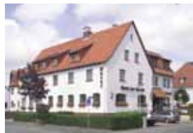
Hotel-Restaurant „Zur Struth“ Inh. Gerhard Dickmann