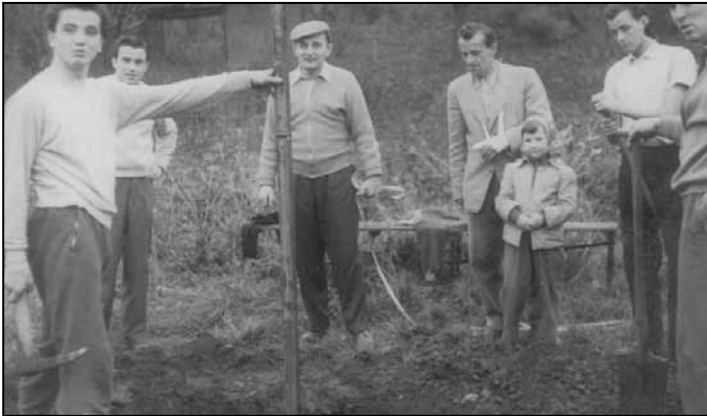
Bau des Kleinfeldes hinter der Jahntur- nalle