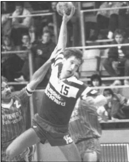
Viele Zuschauer beim Spiel ETSV – Niedervellmar in der ‚Heuberghalle‘ (1990)

Machen wir nun einen kleinen zeitlichen Sprung. In den siebziger Jahren wurde die Heubergsporthalle (1968 fertiggestellt) zum Mekka der Handballzuschauer aus Eschwegen. Die Mannschaft spielte damals in der Verbandsliga. 500-600 Zuschauer waren keine Seltenheit und sie fanden ein komfortables Sitzangebot vor. Die allermeisten von ihnen konnten einzelne Holzklappsitze belegen, die aus einem ehemaligen Eschweger Kino stammten und beim Bau der Halle mit eingebaut worden waren. Eine weitere Besonderheit der damaligen Zuschauerstimmung: Zeitweise wurde die Stimmung zusätzlich angeheizt, indem viele Zuschauer mit Haustürschlüsseln auf die vor ihnen befindlichen Metallabsperrungen klopfen.