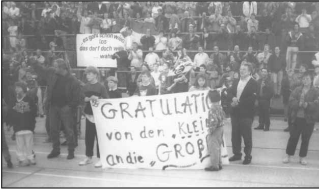
Sehr viele begeisterte Zuschauer beim Spiel ETSV – Langgöns (1992)

Als der ETSV dann – in der Regionalliga angekommen – in die Halle der Beruflichen Schulen in Eschwege umzieht, steigern sich die Zuschauerzahlen wiederum. Als man