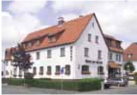
Hotel-Restaurant „Zur Struth“ Inh. Gerhard Dickmann